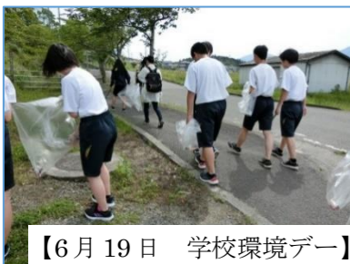
【6月19日 学校環境デー】

6月5日、四日市中央緑地公園競技場にて体育祭を開催しました。好天に恵まれ、全種目が予定通りに行えました。学年別クラス対抗戦ではクラス全員の結集がみられ、クラブ対抗リレーや選抜男女混合リレー等、全力で走る姿がまぶしく見えました。